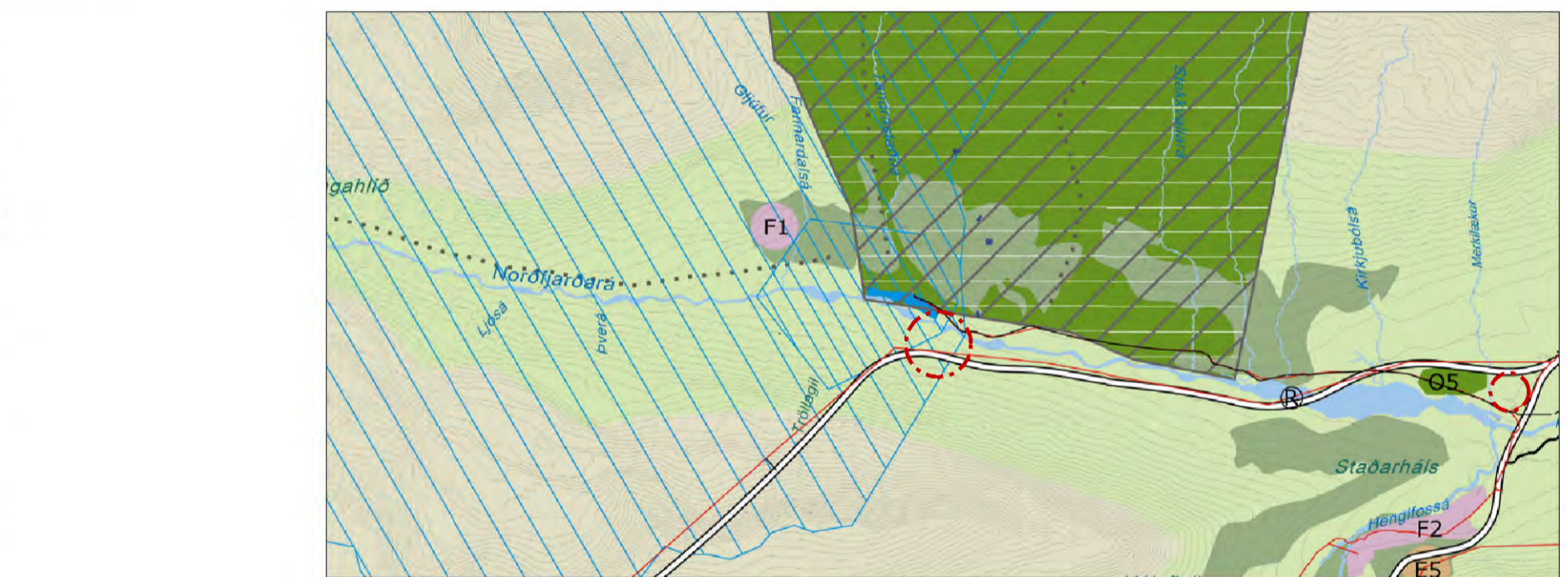
HLUTI AF STAÐFESTU AÐALSKIPULAGI FJARÐABYGGÐAR 2007-2027

Notkun bygginga á hverjum reit er ekki fastákveðin og ræðst af þörf. Miðast er við að byggingar verði á einni hæð og heldirbyggingarmgn verði allt að 1100 m 2 .