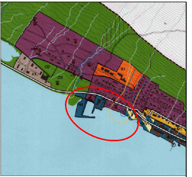
Aðalskipulag Fjarðabyggðar 2007 -2027