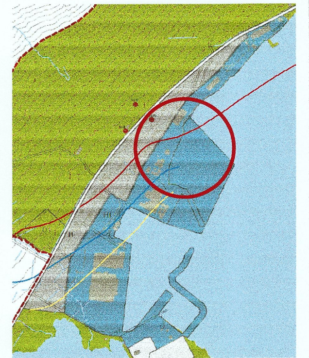
Skýringarmynd: Hluti aðalskipulags Fjarðabyggðar 2007-2027, þéttbýlisuppdráttur fyrir Norðfjörð m.s.br.

Að öðru leyti gilda skilmálar gildandi deiliskipulags.