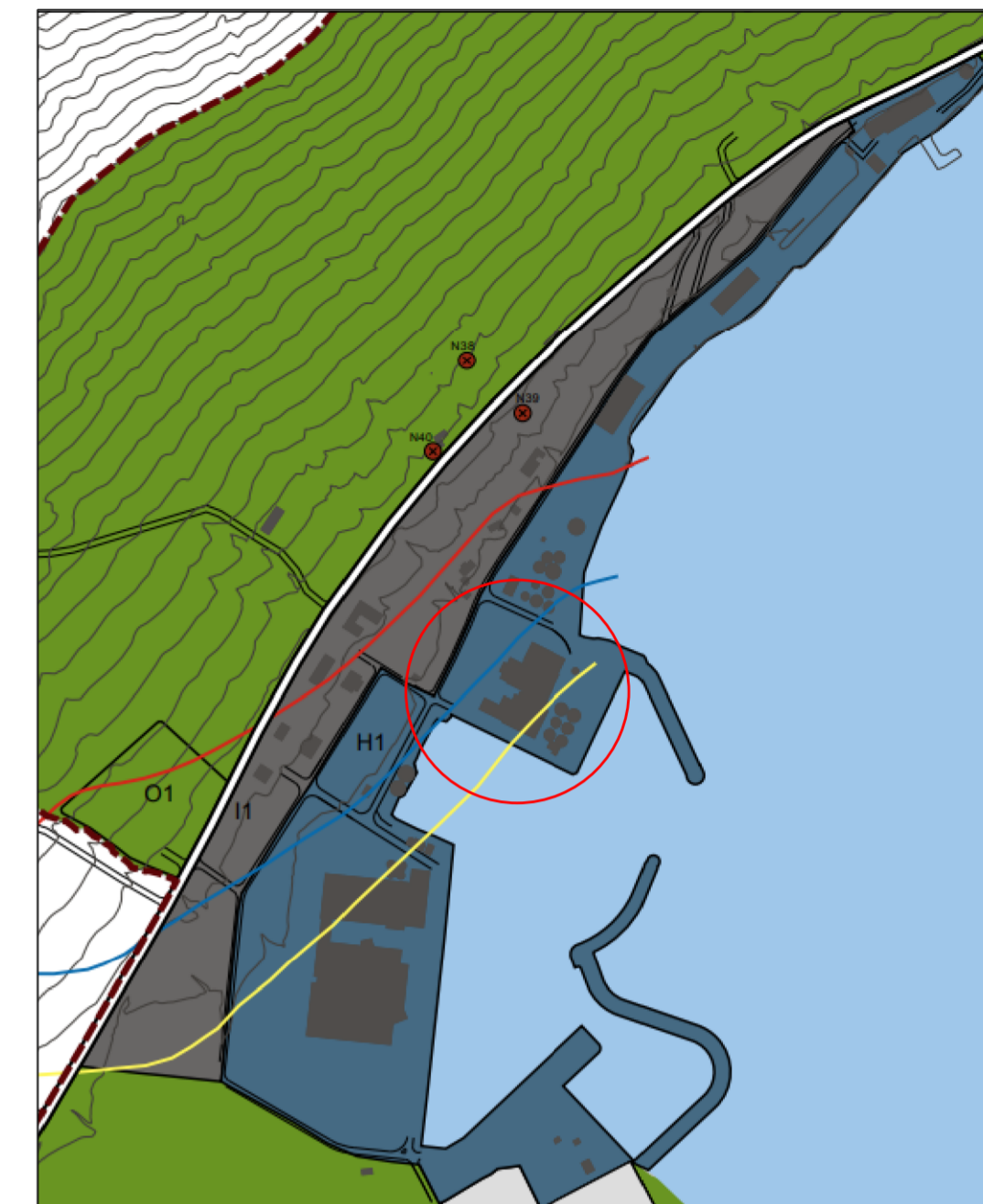
Staðsetning lóðar á aðalskipulagi Fjarðabyggðar 2007-2027