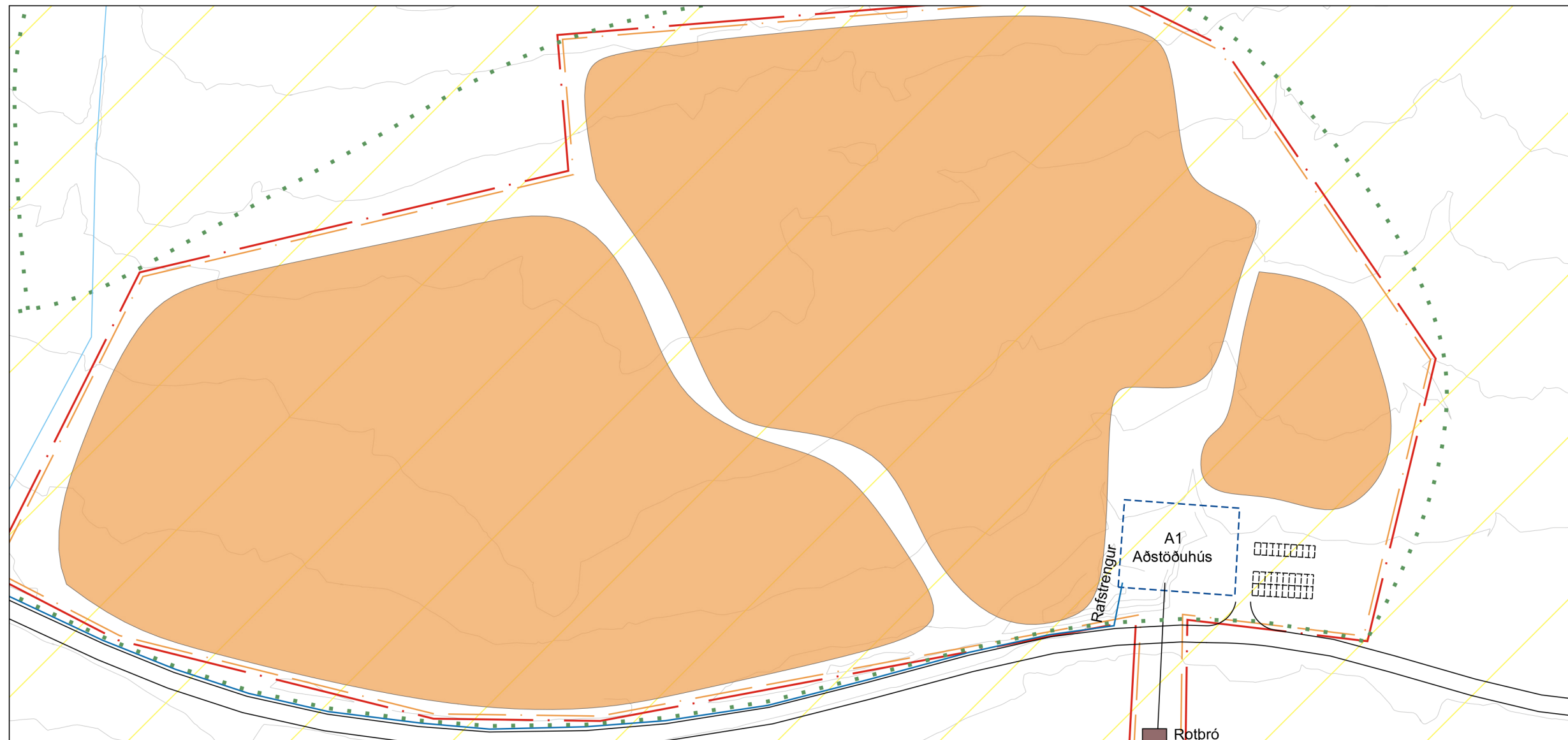
AKSTURSÍPRÓTTASVÆÐI. HELSTU FRAMKVÆMDARSVÆÐI MKV: 1:2.000